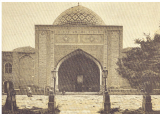
Göy məscidin portalı. (Bax: Linch, H. F. B. Armenia. Travels and Studies. London, 1901, p. 215).

idi. Sadə görkəmli zalların yalnız həyə-tə baxan pəncərələri şəbəkə üslubunda iş-lənilmiş və rəngli şü-şələrlə bəzədilmişdi. Həyətin şimal hissə-sində kiçik bir ibadət-xana da var idi. Məscidin minarəsi çox gözəl idi və İrə-vanın tikililəri ara-sında ən hündür ol-duğundan şəhərin hər yerindən görünürdü. Azançı onun minarəsinə çıxaraq hər gün müsəlmanları ibadətə çağır-ırdı. Məscidin cənub portalının üzərindəki kitabədə Hü-seynəli xanın adı və tikilmə tarixi həkk olunmuşdu. 13