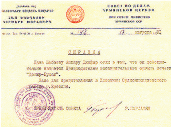
Dəmirbulaq məscidinin axunduna verilən arayış. 1984.

oğlunun Dəmirbulaq məscidinin icraiyə orqanının sədri olduğu göstərilmişdir. Həmin orqanın 2 iyun 1985-ci ildə verdiyi digər arayışda Myasnikyan rayonu, Nərimanov küçəsi–145 (hazırda Vardanans küçəsi) ünvanında yerləşən Dəmirbulaq məscidi üçün siqnalizasiya quraşdırılması məsələsi qaldırılmışdır.