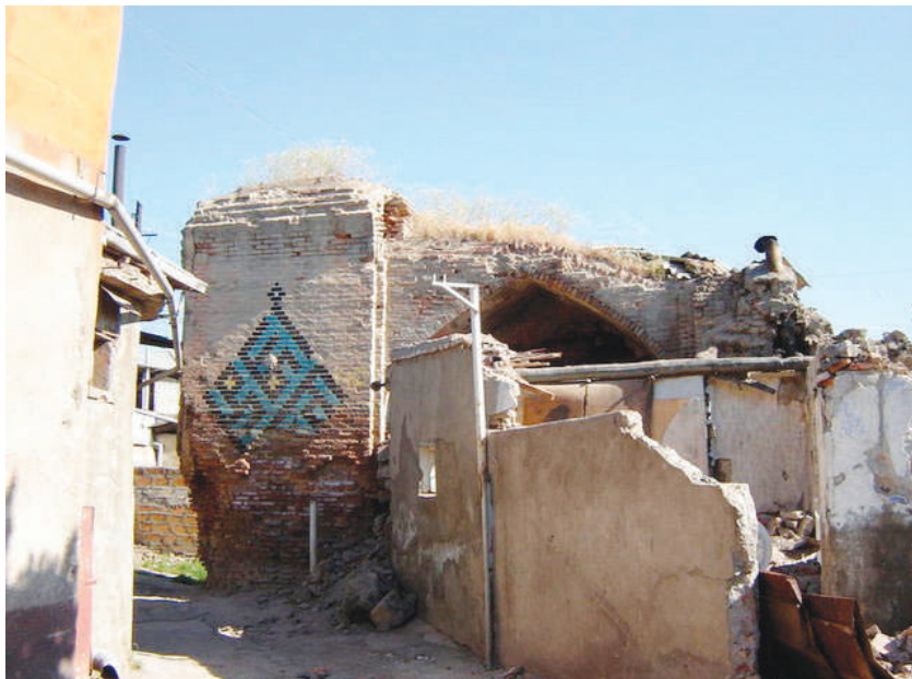
Erməni vandalları tərəfindən dağıdılmış Sərdar məscidinin xarabalıqları. XX əsrin sonları.

1864-cü ildə İrəvan qalasından rus qoşunlarının hərbi-istehkam məqsədilə istifadəsinə son qoyulduqdan sonra qaladakı tarixi-memarlıq abidələri, o cümlədən Sərdar, yaxud Abbas Mirzə məscidi ciddi dağıntılara məruz qalmışdır. XX əsrin əvvəllərində Sərdar məscidində Türkiyədən köçüb gələn ermənilər məskunlaşdırılmışdı. Sovet Ermənistanı dövründə isə Sərdar məscidi hissə-hissə dağıdılaraq onun yerində yaşayış evləri tikilmişdir.