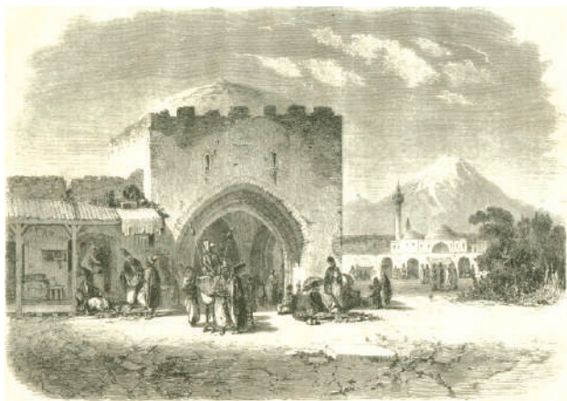
İrəvan bazarı və Göy məscid. 1875. Rəssam Paul von Franken, qravürəçi R. İllner.

1909-cu ildə Hacı Müzəffər ağanın Dəmirbulaqda tikdirdiyi məscidi və İrəvan qadınlar klubunun yaxınlığında yerləşən Əsəd ağanın tikdirdiyi məscidi də nəzərə alsaq, deməli, 1918-ci ildə İrəvan quberniyası ərazisində erməni dövləti yaradılanadək İrəvan şəhərində azı 10 məscid mövcud olmuşdur.