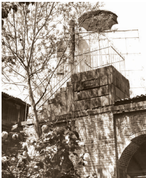
Dəmirbulaq məscidinin çətirli minarəsi. 1987-ci il.

Hazırda yoxdur. Erməni vandalları tərəfindən dağıdılmışdır.