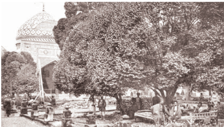
Göy məscidin həyatı. Oktyabr, 1897. (Bax: Sarre Friedrich. Transkaukasien, Persien, Mesopotamien, Transkaspien. Berlin, 1899, p. 29).

berniyasında 310 məscid mövcuddur ki, onlardan 7-si İrəvan şəhərindədir. 5