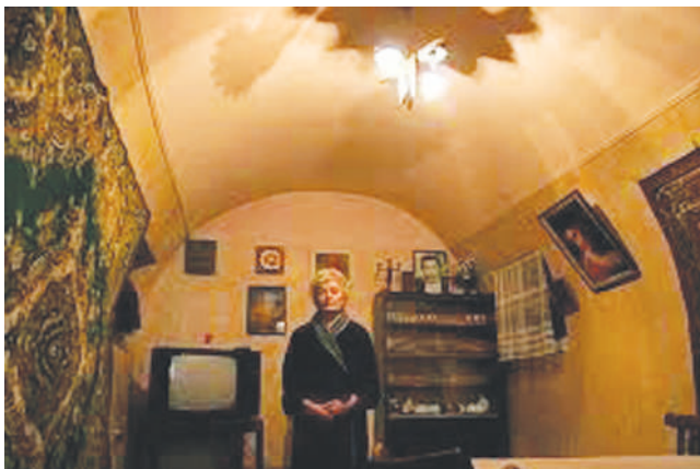
Təpəbaşı məscidində yaşayan erməni köçkünlərindən biri.