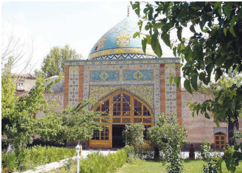
Göy məscidin bir hissəsi bərpadan sonra. 2006.