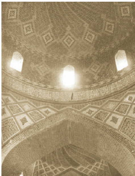
Abbas Mirzə məscidinin ibadət zalının günbəzi. 1897.