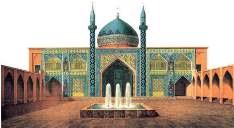
Sərdar məscidi. Rəssam Dübua de Monpere, qravüraçı Nikole Erkül.

İrəvan şəhərində mövcud olan azərbaycanlılara məxsus tarixi-memarlıq abidələrinin, o cümlədən də məscidlərin məşhur rus fotoqrafı Dmitri Yermakov tərəfindən XIX əsrin 80-90-cı illərində çəkilmiş fotoları fotoqrafın 1896 və 1901-ci illərdə çap etdirdiyi albomlara daxil edilmişdir. Dmitri Yermakovun İrəvan məscidləri ilə bağlı çoxsaylı fotolarının bir