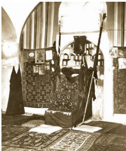
Erməni vandalları tərəfindən dağıdılan Dəmirbulaq məscidinin içəridən görünüşü. 1987.

Dəmirbulaq məscidindən bəhs etmişdir. R. Kullen yazır ki, bir gecə İrəvanda erməni dostu onu apara-raq Qnuni küçəsindəki 22 №-li evin arxasında bir qalaq zibilliyi göstərmişdir. Dostu qorxa-qorxa R. Kul- lenə söyləmişdi ki, Erməni-standa azərbaycanlılar yaşadığı zaman həmin yerdə onlara məxsus məscid binası olmuşdur. R. Kullen yazır ki, İrəvanda qırğınlar və azərbaycanlıların şəhərdən qovulması zamanı qonşuluqda yaşayan er-