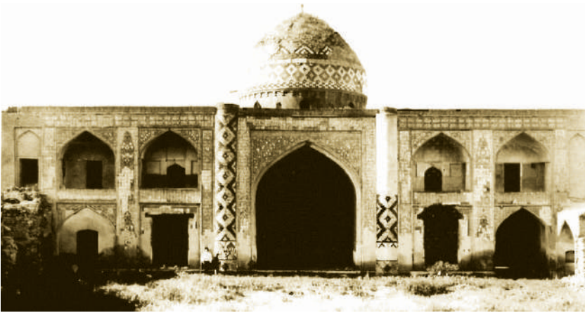
Abbas Mirzə məscidi. XIX əsrin sonlarında.

də vəziyyətini təsvir etmişdir. Nikolay Marr İmperator Arxeoloji Komissiyasının 17 may 1912-ci il tarixli iclasında etdiyi məruzəsində yazırdı: “Məscid indi də yaxşı vəziyyətdədir, lakin onun qorunması üçün heç bir tədbir görülmür və hər şey Sərdar sarayının vəziyyətinə düşməsinə (yəni dağıdılmasına – red.) xidmət edir. Bununla belə, o, yerli müsəlman mədəniyyətinin qiymətli irsidir: günbəzin içərisində çevrəsi boyunca ərəb hərfəri ilə kitabə mövcuddur; mehrab üzərindəki naxışlar xalçaya bənzəyir və yüksək dərəcədə üslubludur. Günbəzi çat vermişdir və onu çoxdan təmir etmək lazım idi.” 10