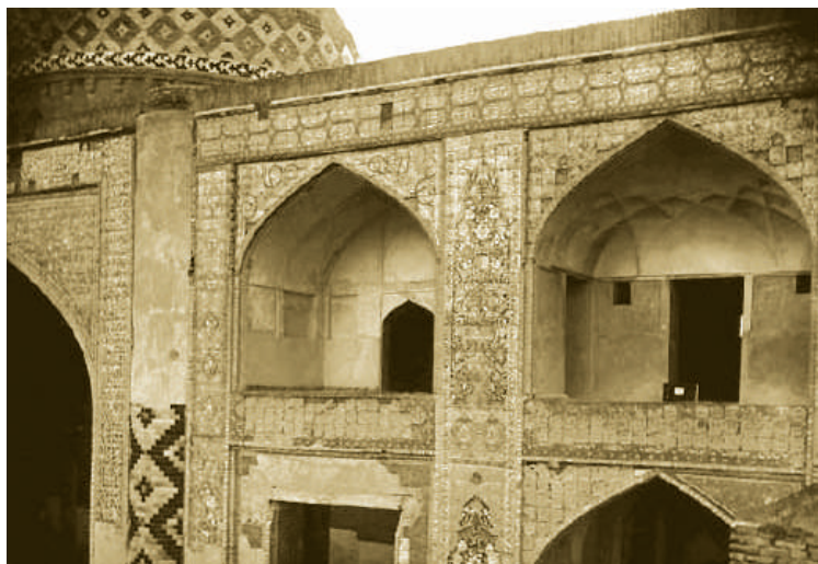
Abbas Mirzə məscidinin fasadından bir görünüş. 1897. Foto. Frierdrix Sarre. Berlin Dövlət Muzeyi.

Abbas məscidindən daha qədim bir məscidin olduğunu və onun şah Xudabəndə* tərəfindən inşa edildiyini söyləmişdir. Müəllif evlərin arasında gördüyü həmin köhnə, bərbad vəziyyətdə olan məscidin divarlarının uzunluğunun 9 m, eninin 6 m olduğunu, alçaq mehrablı, qırmızı kərpicdən inşa edildiyini qeyd edir. İ.Əzimbəyov çıxış qapısının üzərindəki kitabədə məscidin 1098-ci il hicri tarixində, yəni miladi tarixi ilə 1685-ci ildə inşa edildiyinin göstərildiyini yazır. 11